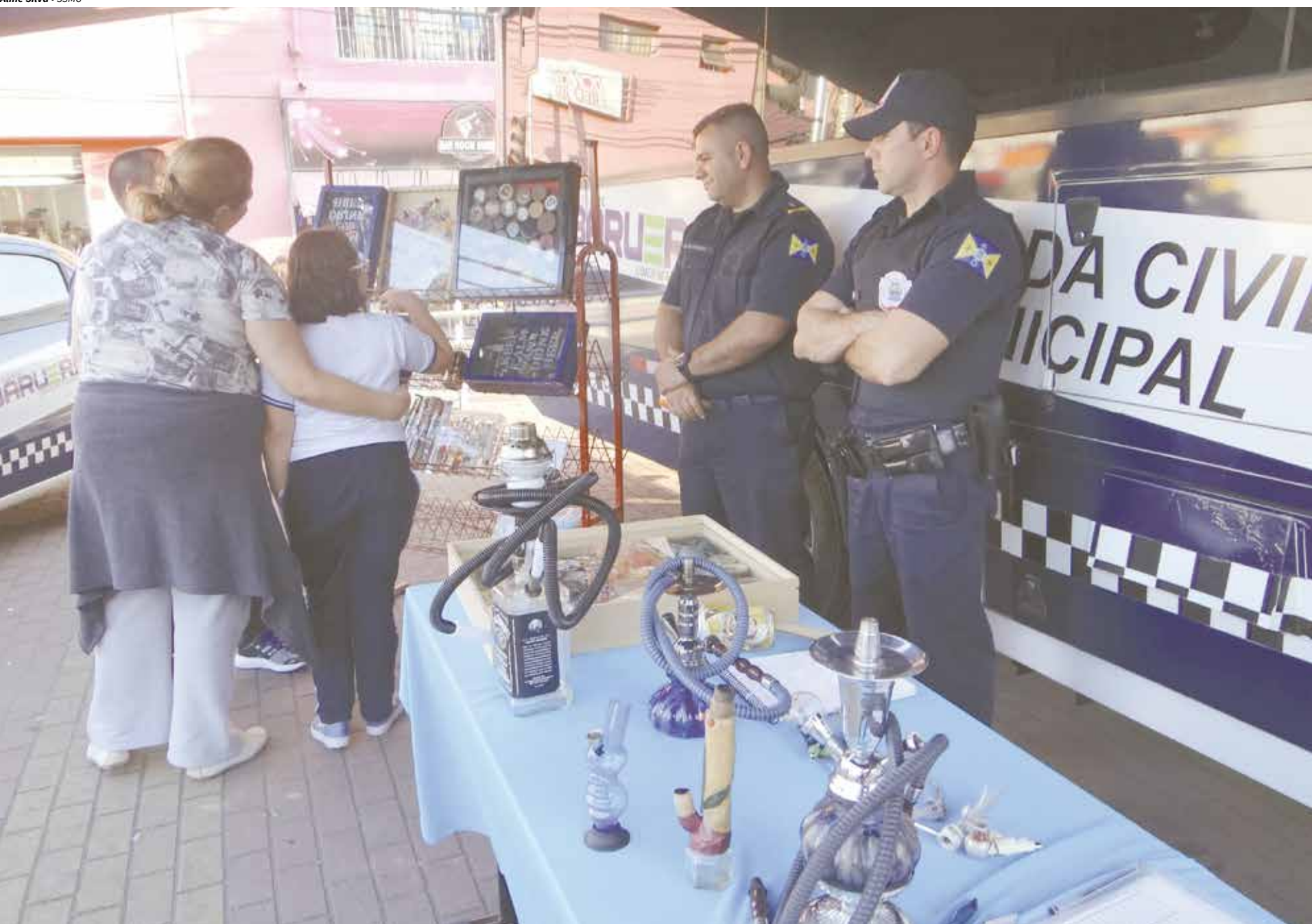
Guardas municipais orientaram a população no bulevar central