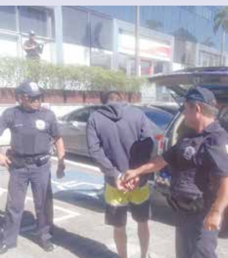
Manobra proibida despertou a atenção da equipe da Guarda

Após o registro do caso no 2º Distrito Policial da cidade, o veículo e a carga foram entregues aos responsáveis legais e o ladrão foi conduzido até a cadeia Pública de Carapicuíba. (AS)