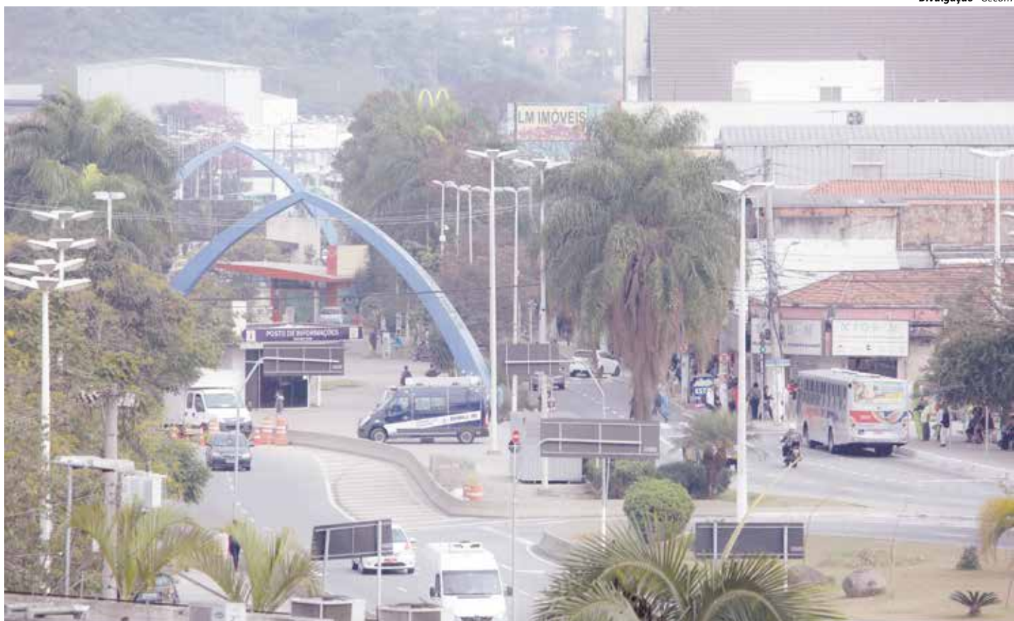
Interdição agora é na Henriqueta para os mesmos serviços executados na 26 de Março

No geral, o projeto prevê ainda remoção dos postes de concretos e toda rede de distribuição aérea, pois a finalidade é diminuir a poluição visual, oferecer melhorias no fornecimento de energia elétrica, além de proporcionar mais conforto aos cidadãos e todo o comércio local.