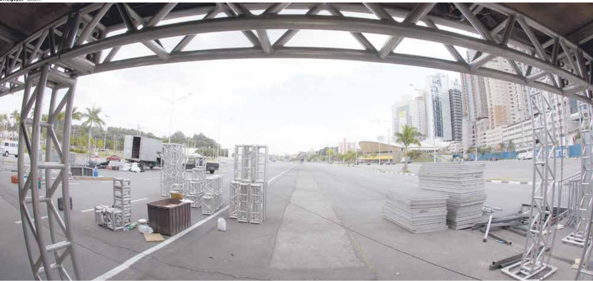
Na área central, a festança será ainda maior.